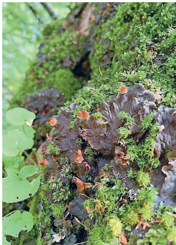
Leben auf dem Leben: Bergahorne bieten einer Vielzahl an anderen Organismen einen Lebensraum.