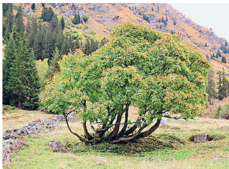
Indian Summer in Sardasca/Klosters: Ein uralter Bergahorn-«Zwerg» trotz Lawinen und Witterung.

das Bergahorn-Projekt eine ganz tolle Sache. Man weiss, was alles auf und in den Bäumen lebt – es ist gut, dass die Bäume geschützt und Neupflanzungen gefördert werden», sagt er und ist einer der ersten Grundeigentümer, die sich am Projekt beteiligen. Die Chancen sind also intakt, dass der Prättigauer Bergahorn zum neuen Baumliebbling der Bevölkerung und regionalen Aushängeschild wird. (Regula Waldner)