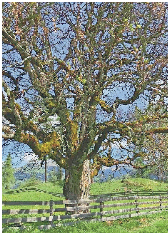
Monumentaler geht fast nicht mehr: So ausladend durfte ein alter Bergahorn im Offenland bei Conters/Plandagorz werden.